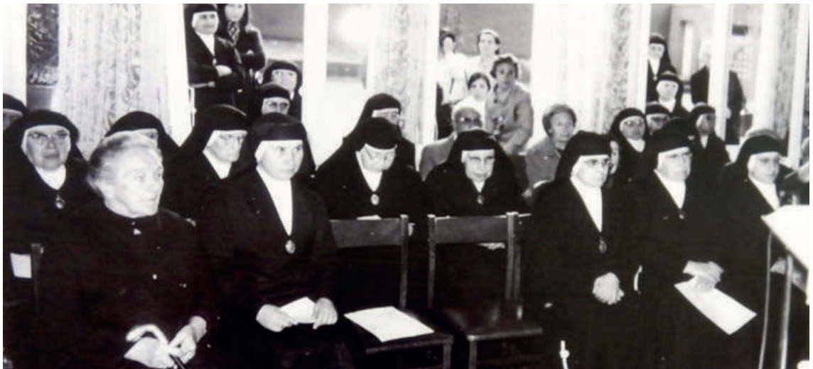
Residencia “Nativitat de Ntra. Sra.”. Día de la inauguración. Hermanas y residentes. 23 de marzo de 1972

Como sabéis el día 9 de junio celebramos, los cincuenta años, de la Residencia La Natividad de Nuestra Señora (Barcelona). En el año 1936 fue donado el terreno a la Congregación. Solo después de la guerra, la casa empezará a acoger residentes, unas quince. Más tarde, se construyó el edificio actual para ampliar más plazas y modernizar el servicio que se presta; fue inaugurado día 23 de marzo de 1972. Desde entonces son muchas las personas que han pasado por ella (hermanas, residentes, trabajadores, voluntarios), personas que, con su buen hacer, han facilitado que la residencia siga prestando su servicio, tan necesario, delicado y gratificante.