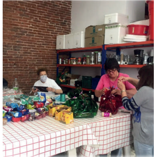
Preparando los paquetes de navidad para los pobres de la noche y que serán regalados por el grupo de la olla