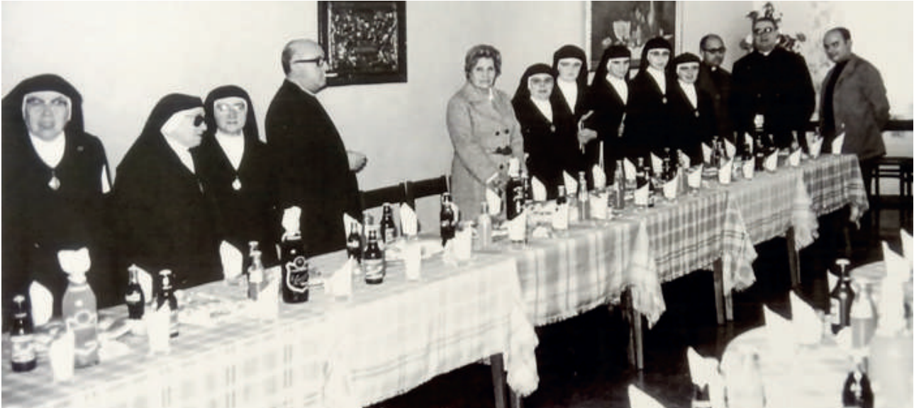
Residencia “Nativitat de Ntra. Sra.”. Día de la inauguración. Comedor general. Barcelona, 23 de marzo de 1972.